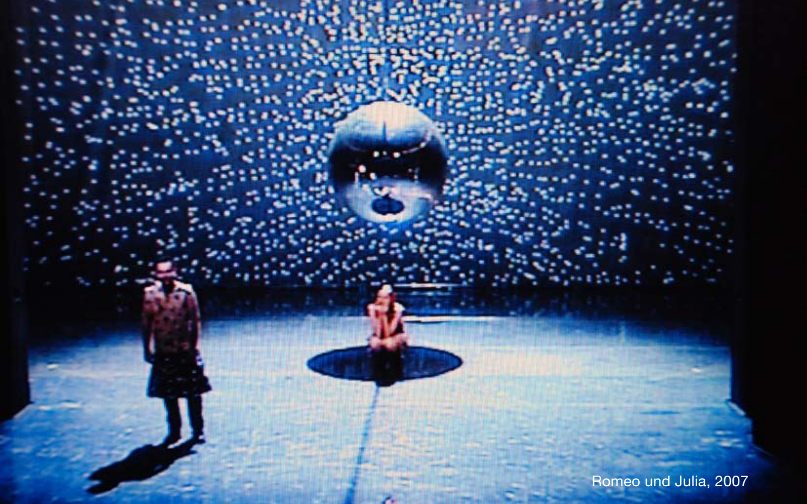
Romeo und Julia, 2007