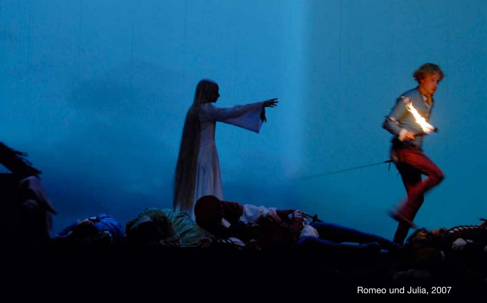
Romeo und Julia, 2007