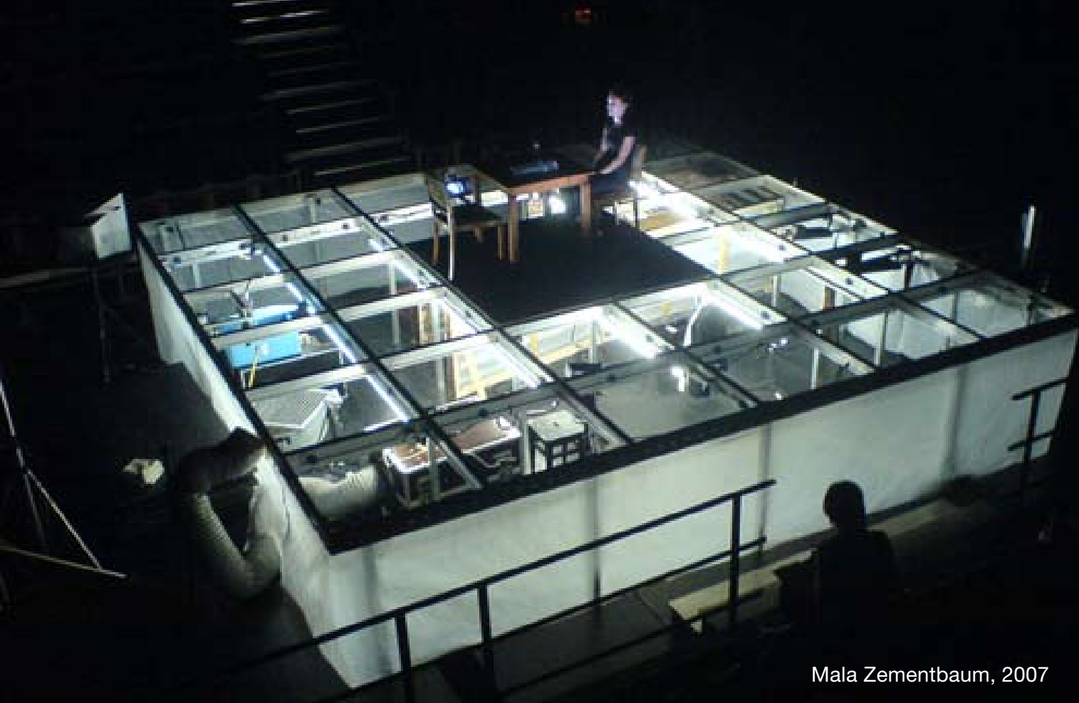
Mala Zementbaum, 2007