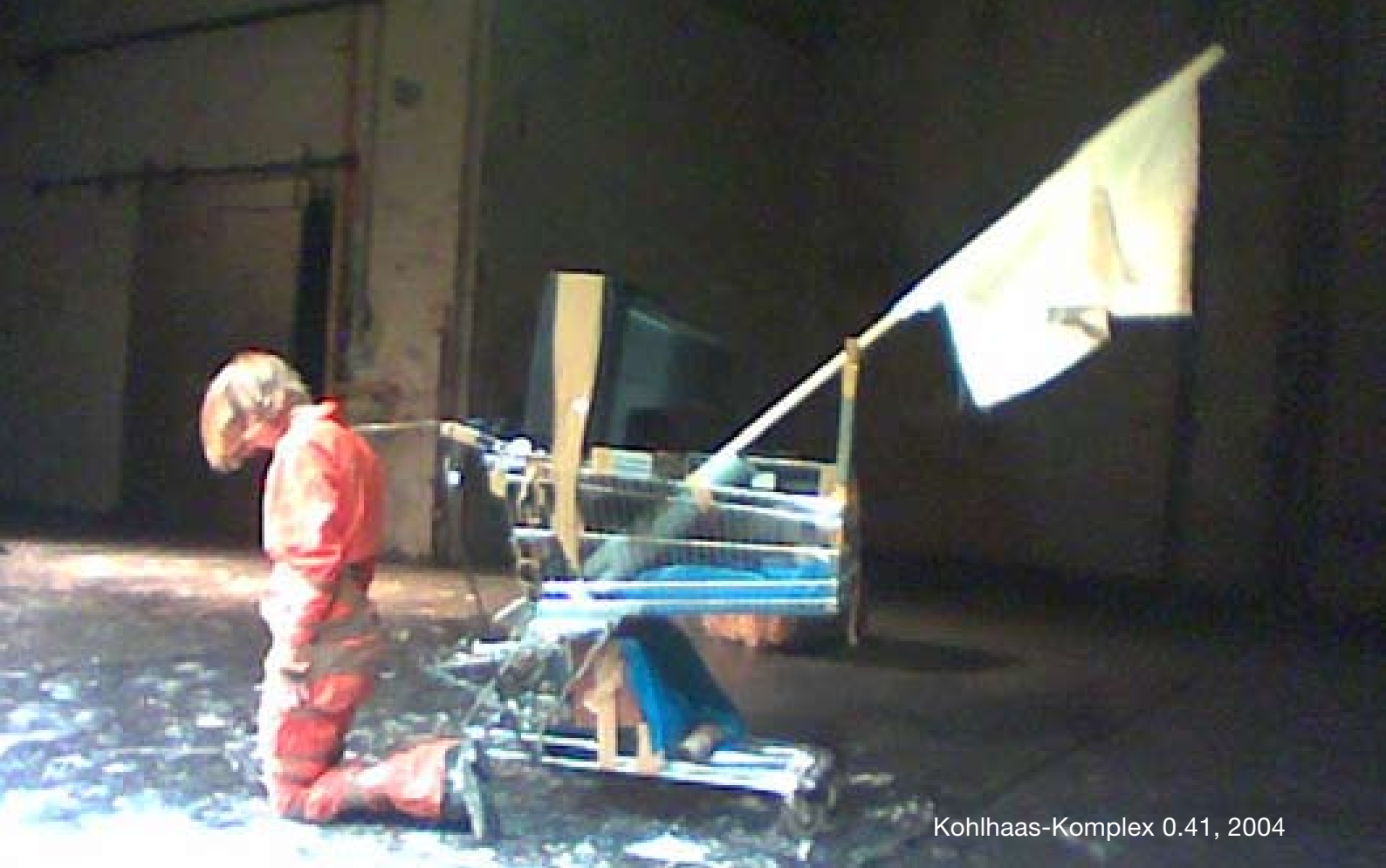
Kohlhaas-Komplex 0.41, 2004